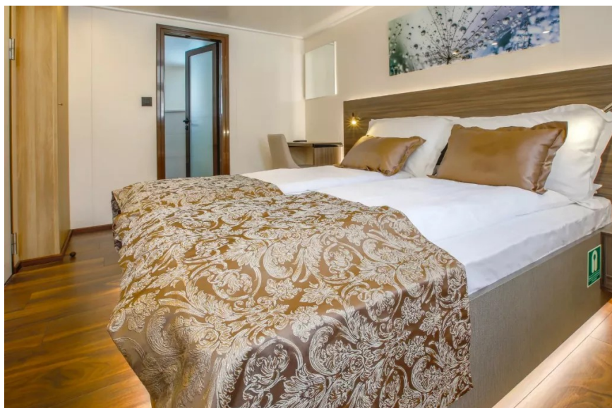
2-Bett Kabine Oberdeck