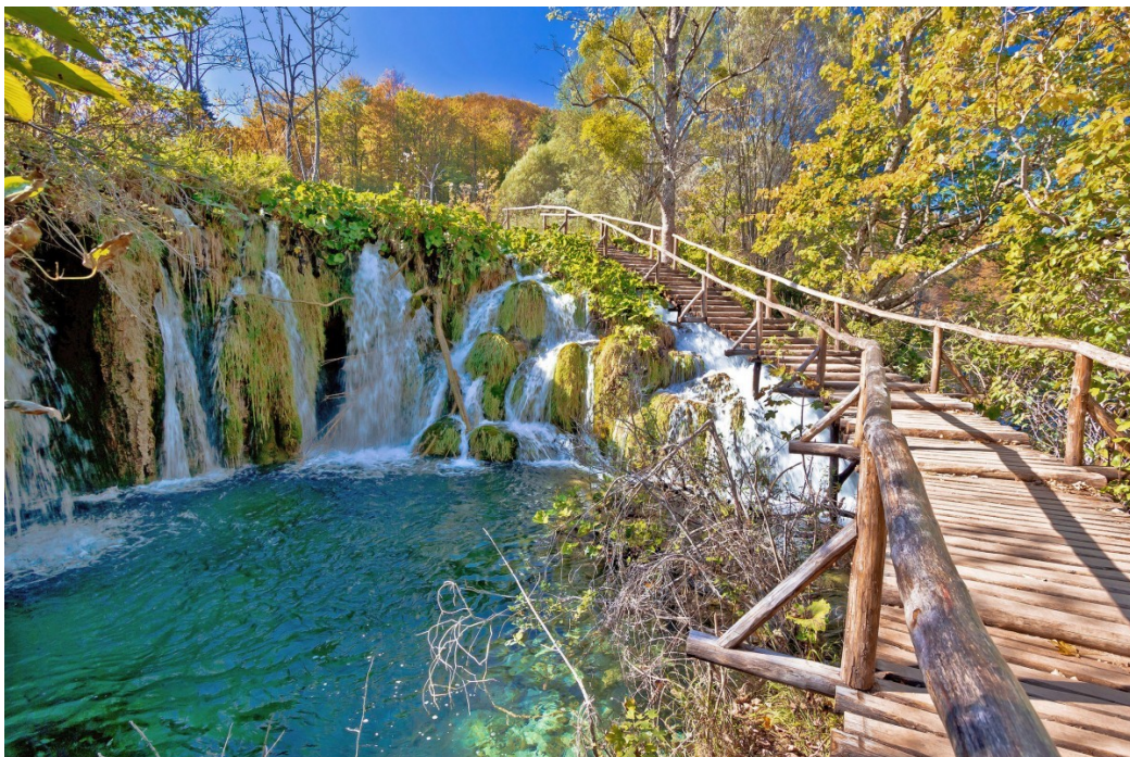
Nationalpark Plitvicer See