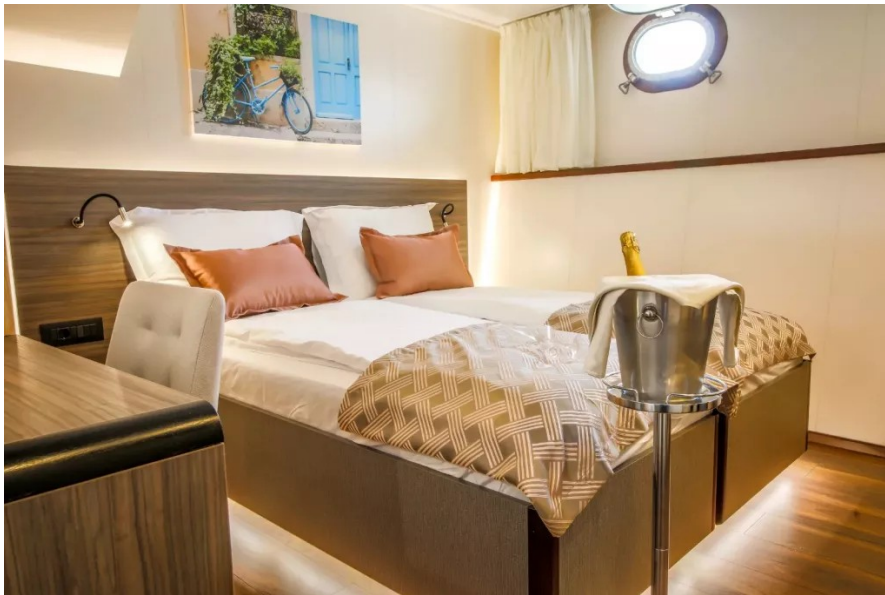
2-Bett Kabine Hauptdeck

Die Kabinen auf den Oberdecks (ca. 12-14 m 2 ) haben zu öffnende Fenster und sind entweder über die Deckspromenade zugänglich (Kabinen 8-11 und 19) oder über das Schiffsinnere (Kabinen 12-17).