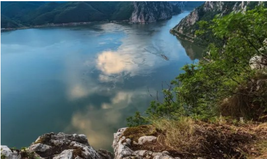
Passage „Eisernes Tor“

MS Maxima erreicht am frühen Morgen wieder Passau. Nach dem Frühstück gehen Sie bis ca. 09:30 Uhr von Bord - Ihre Donaukreuzfahrt ist leider schon wieder zu Ende.