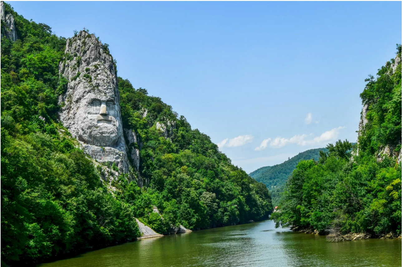
Kataraktenstrecke mit Decabe und Eisernem Tor

Es gelten die Allgemeinen Reisebedingungen des Veranstalters "nicko cruises" Flussreisen GmbH, Mittlerer Pfad 2, 70499 Stuttgart. Mein Reisebüro „Nah und Fern“, Marktstr. 1, 99444 Blankenhain ist nur Vermittler dieser Reise.