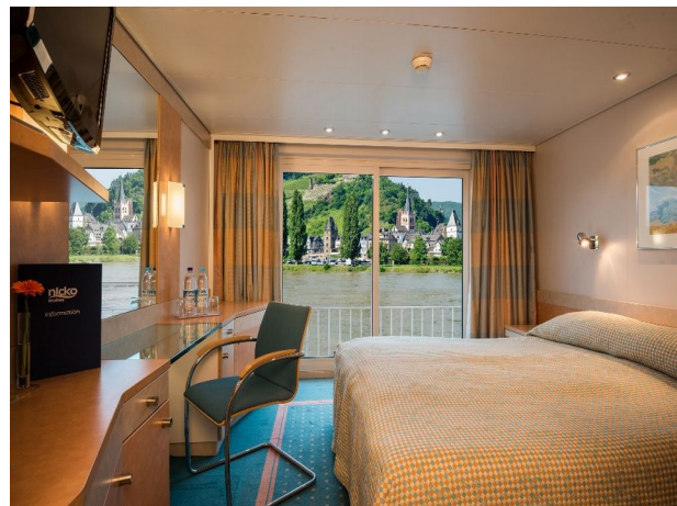
Mitteldeck mit franz. Balkon